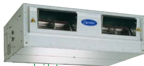
AQUASNAP JUNIOR 30RA/RH

42JW лесно може да бъде оборудван с модул Ostorus (предлага се като аксесоар), който позволява свързване на 2 до 4 въздуховода за климатизация на 2 до 4 отделни помещения.